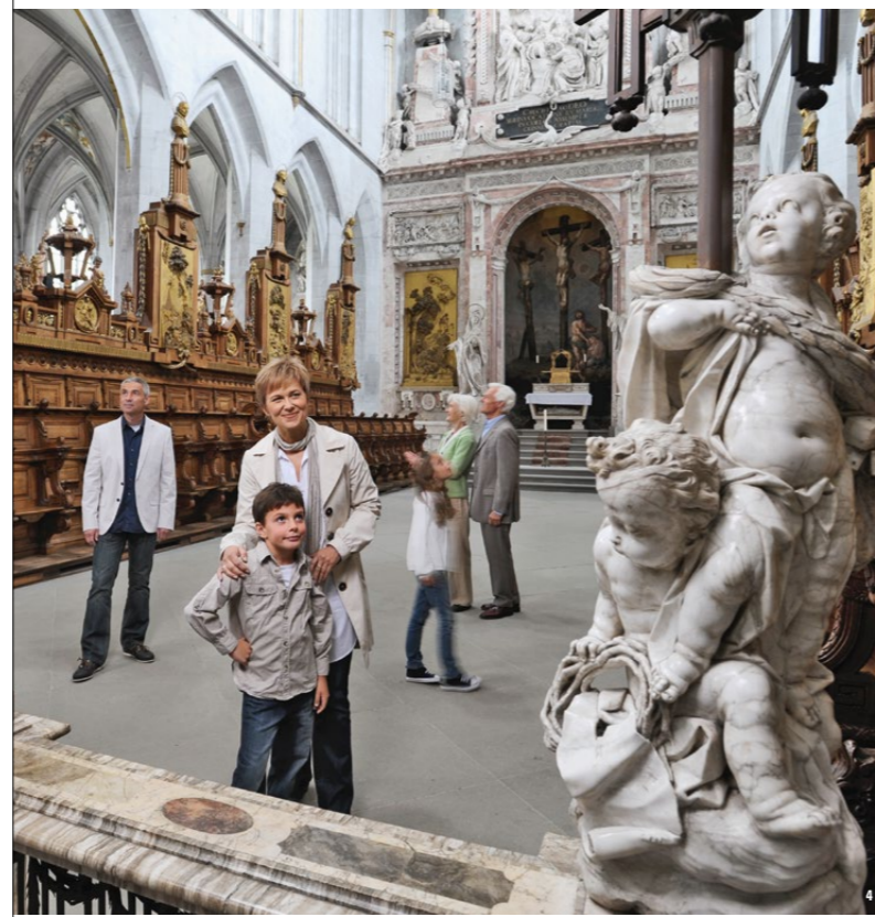
De scintillants ouvrages en albâtre du XVIII e siècle ornent la cathédrale gothique

À droite : Salon de l'abbé dans la prélatrice